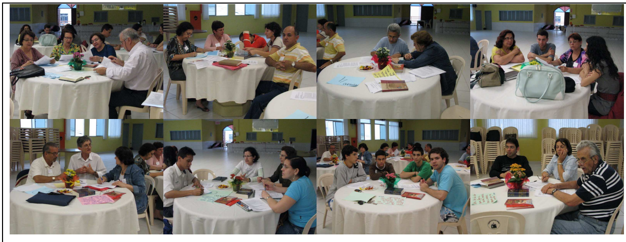
Grupos trabalhando na construção das propostas de Lema e Objetivo Geral

Analisadas as sugestões e revendo o objetivo geral da CNBB ( evangelizar a partir do encontro pessoal com Cristo à luz evangélica da opção preferencial pelos pobres, promovendo a dignidade da pessoa renovando a comunidade participando de uma sociedade justa e solidária para que todos tenham vida e a tenham em abundância ) e o objetivo geral da Arquidiocese ( evangelizar sendo igreja seguidora de Jesus Cristo na palavra, no testemunho, na oração, na partilha e na fração do pão envolvendo as forças vivas da arquidiocese a serviço da vida e esperança ), chegamos ao nosso objetivo geral: