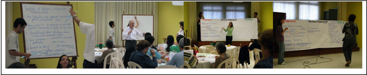
Construção dos seis programas para 2009, a partir das propostas das lideranças