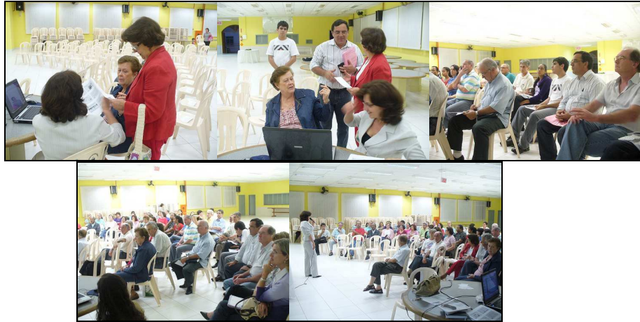
Lideranças presentes ao CPP do dia 07/11/08

Submetido à análise, em 07/11/08 , na reunião do Conselho Pastoral Paroquial (CPP), o esboço do projeto teve aprovação, embora com algumas restrições, especialmente quanto à data de realização (uma vez por semana todas as quintas-feiras). Isso gerou um desconforto e a necessidade de repensar o projeto.